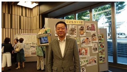
「アシスとしま」キックオフイベント会場にて

これまで、18歳を超えた若者の悩みごとなどの相談を受付ける「若者のためのわかりやすい相談窓口」がなかったことを受け、様々な「生きづらさ」を抱える、子どもやおおむね39歳までの若者、そしてそのご家族のための相談窓口を開設しました。必要に応じて専門機関と連携しながら、相談者一人ひとりに合わせた支援プログラムを実施します。豊島区役所本庁舎4階東側11番窓口に、子ども若者総合相談窓口「アシスとしま」が区役所の常設型としては、23区で初めて設置されました。