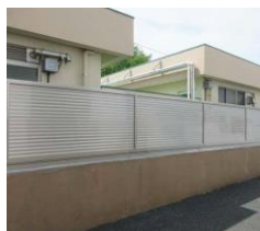
要小学校のブロック塀をルーバータイプに改修